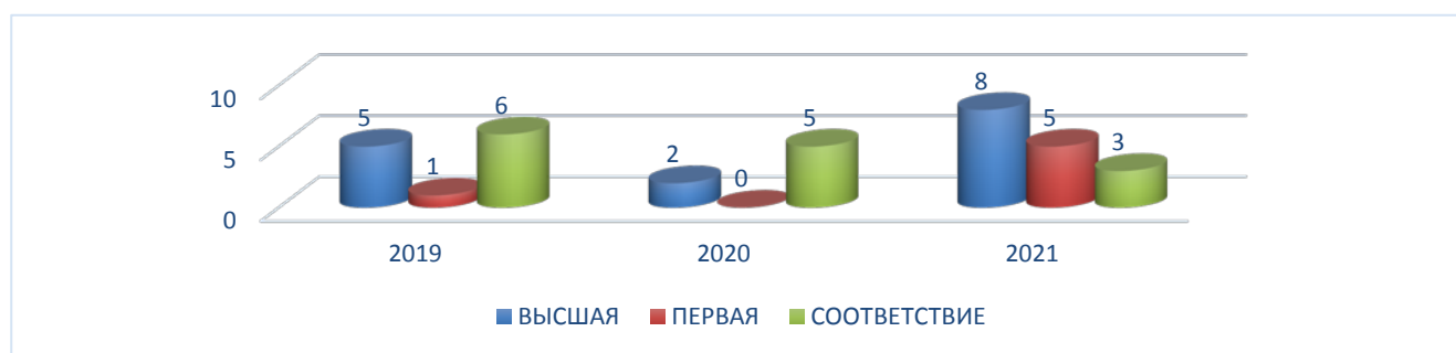
Диаграмма 2 Динамика повышения квалификации педагогов за 2019-2021 гг

Вывод: наблюдается рост учителей с высшей и первой категорией.